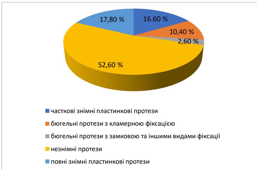
Рис. 2. Розподіл видів знімних конструкцій серед загальної кількості виготовлених протезів.

(12190 од.); бюгельні протези з кламерною фіксацією – 10,4 % (7100 од.); бюгельні протези з замковою та іншими видами фіксації – 2,6 % (1803 од.).