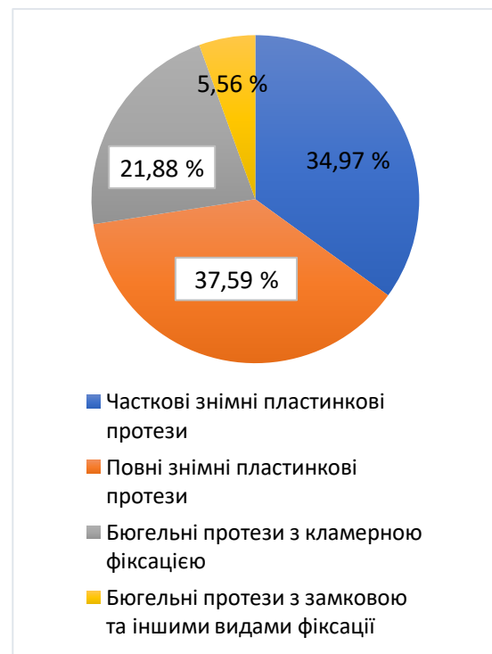
Рис. 1. Розподіл знімних протезів в залежності від конструкції.

Кількість виготовлених знімних протезів була 32441 од., що становить 47,43 % від загальної кількості. З них 23538 (72,56 %) склали пластинкові протези (часткові – 11340 од. (34,97 %); повні – 12190 од. (37,59 %)) та 8903 (27,44 %) склали бюгельні протези (з кламерною фіксацією – 7100 од. (21,88 %), з замковою та іншими видами фіксації – 1803 од. (5,56 %)). Розподіл знімних протезів в залежності від конструкції представлено у діаграмі (рис. 1).